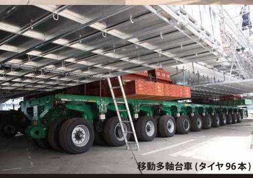
移動多軸台車 (タイヤ96本)